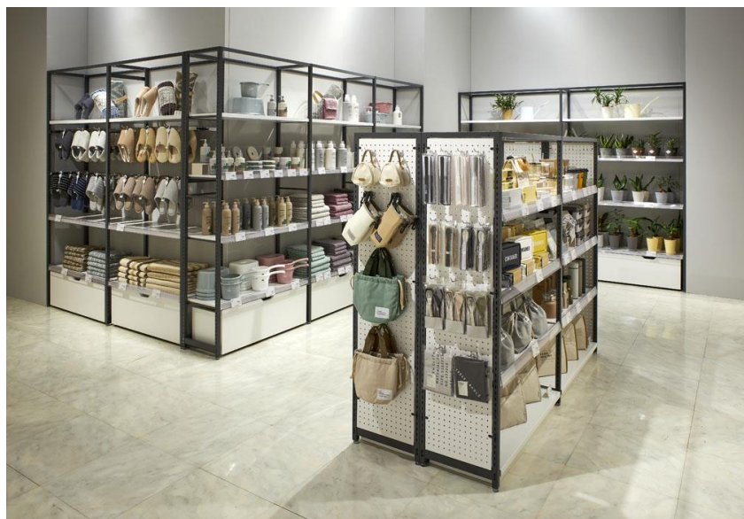
総合カタログ 39号表紙