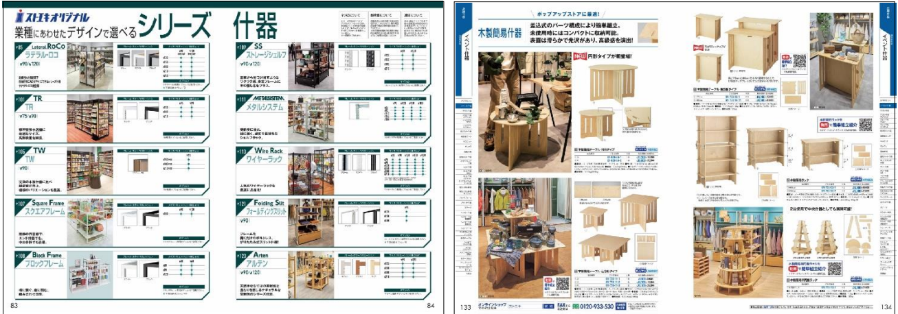
最新号「ストア・エクスプレス総合カタログ 39 号」中面一例

店舗やオフィスに必要な、什器・備品、消耗品、季節装飾などがすべて揃う、業務用通販事業です。商品点数は業界最大級の約 70,000 点。また、「すぐ買って持ち帰りたい、購入前に実物をみたい、専門スタッフに相談したい」などニーズに応えるため、店舗・ショールームを東京・大阪・福岡の 3 拠点に構え、最大 6,000 点を販売しています。