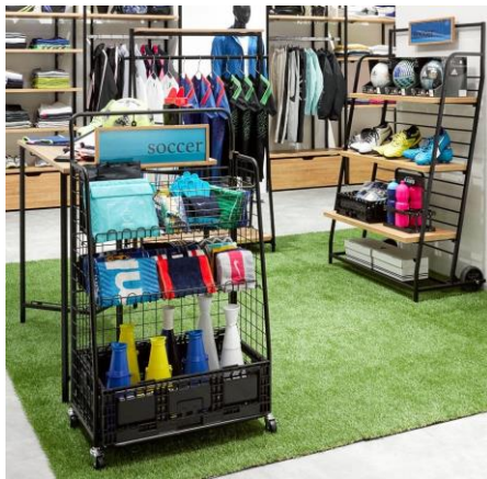
▲ハコマルシェカート (手前) +ハコマルシェトラック (奥)