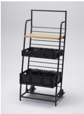
▲ハコマルシェトラック (木棚・樹脂BOXセット)

スポーツ関連売場やイベントなどで商品を引き立てるスポーツマネキンやハンガーラック・テーブル・人工芝などのディスプレイ用品も同時発売。「ハコマルシェ / スポーツシリーズ」と合わせて様々なVMDができる商品を拡充しました。