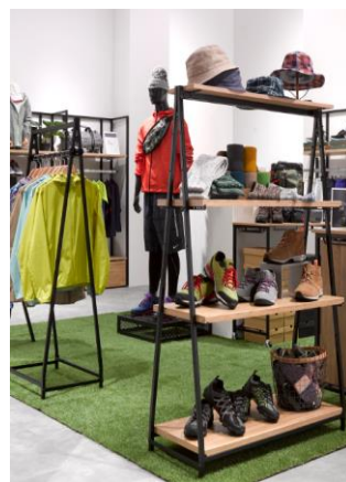
▲ハコマルシェフレーム 棚展開 (手前)・ハンガー展開 (奥)