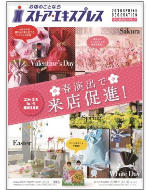
▲春の装飾品カタログ

今年はバレンタインやイースターなどのイベントで使えるフォトスポットアイテムを拡大。また定番の桜に加え、ミモザ、ラベンダーといったトレンドフラワーなど春の演出に役立つアイテムを多数取り揃えています。商品はオンラインショップ、ストア・エクスプレス、ストアデポ各店にてご購入いただけます。