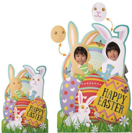
▲輪郭部分が着脱式で、一人でも二人でも使える2WAY顔出しパネル

「天候に左右されない」「場所取りや片づけが不要」とSNSで話題の屋内でのお花見。ストア・エクスプレスでは立ち木からクリップタイプまで桜の装飾品を豊富に取り揃えており、お店のスペースやご予算に合わせたお花見シーン作りにお役立ちいたします。天然木を使用した高級感のある桜なら、置くだけで華やかな空間を実現でき、一味違う演出で集客をサポートします。