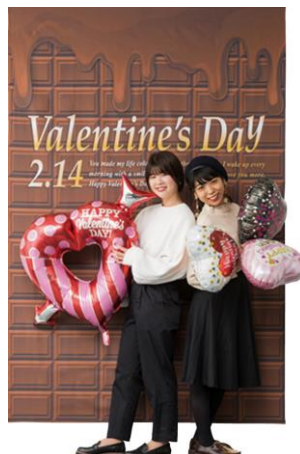
▲SNS映えを狙った板チョコ風のフォトシート