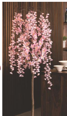
▲天然木を使用した高級感のある立ち木